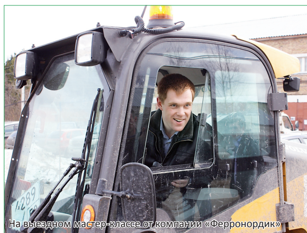
На выездном мастер-классе от компании «Ферронордик»

куратор Лесного образовательного кластера РК