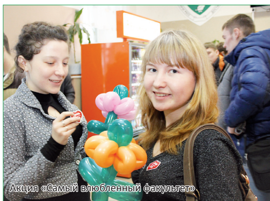
Акция «Самый влюбленный факультет»

– Да, в этом году ребята, отличившиеся в учебе и в научно-исследовательской работе активисты студенческого самоуправления, спортсмены, участники коллективов творческого объединения «Древо», отдохали летом в санатории «Известия». Мы входили в состав конкурсной комиссии, проводя отбор участников для поездки. В общей сложности на черноморском