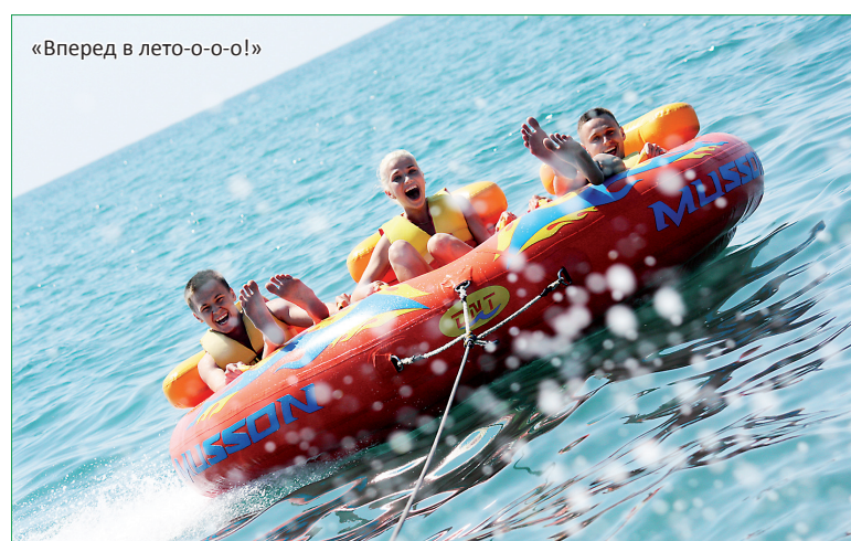
«Вперед в лето-о-о-о!»

Скалистые ущелья, грохочущие водопады, непроходимые, заросшие рододендронами, лавровишней и лианами леса, стремительные горные реки, лабиринты бесчисленных пещер, головокружительные высокогорные лыжные трассы не остались без вни-