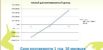
График дисконтированного дохода