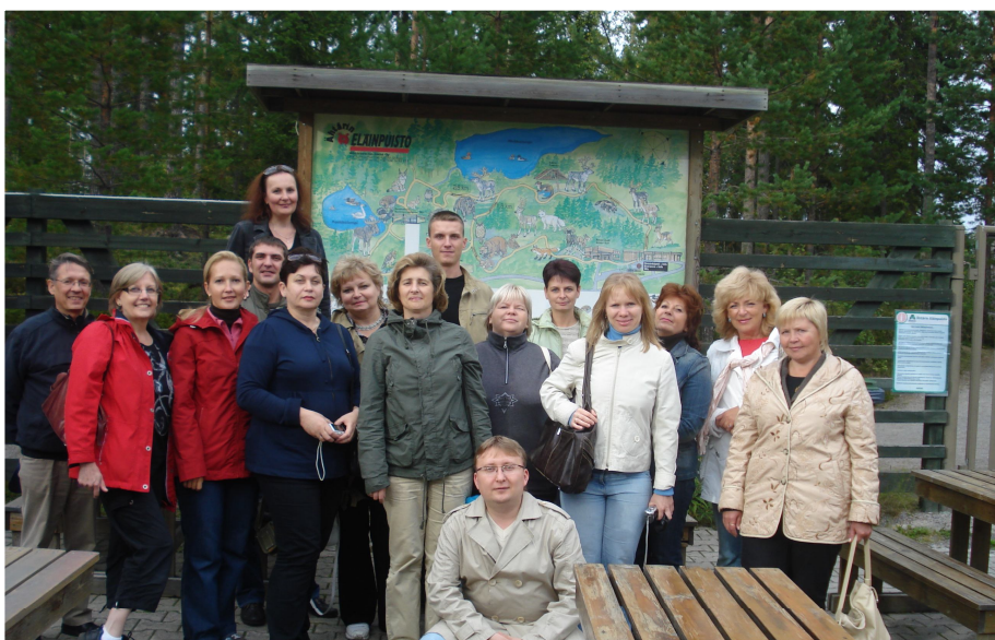
На фото: Слушатели интенсивной летней школы на экскурсии в природном заповеднике Ахтари – ярком примере правильного подхода финнов к организации экотуризма.

В феврале 2008 года в международном отделе СЛИ и у финских коллег из университета прикладных наук г. Сейнайоки возникла идея проведения интенсивной летней школы на английском языке для преподавателей вузов, для того чтобы они получили представление о лесопромышленном комплексе в целом, не ограничиваясь рамками своего предмета; могли узнать много новой информации, которая в большом количестве выходит на английском языке; совершенствовали собственные навыки употребления английской лесной терминологии; подробнее познакомились с современными методами обучения лесным дисциплинам